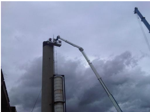
Demolizione ciminiera in cls