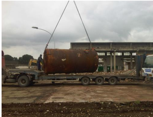
Carico della caldaia da 14 ton