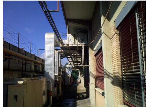
Impianti esterni oggetto di demolizione