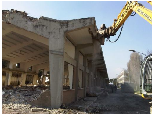
Demolizione con pinza frantumatrice