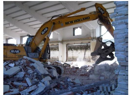
Demolizione con pinza frantumatrice