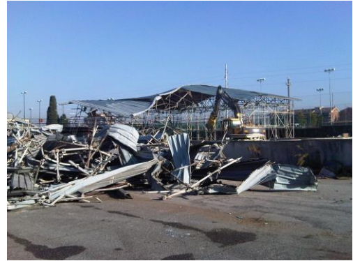
Demolizione strutture in ferro