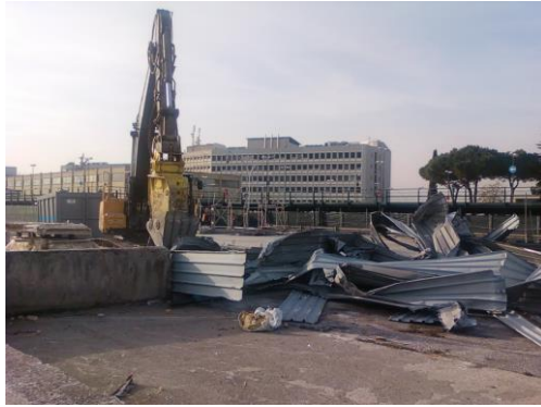
Demolizione strutture in ferro