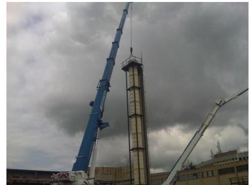
Demolizione ciminiera metallica