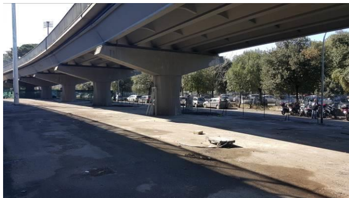
Area post intervento