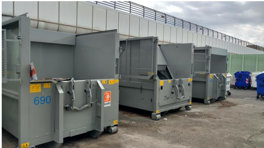
Isola ecologica presso ADR