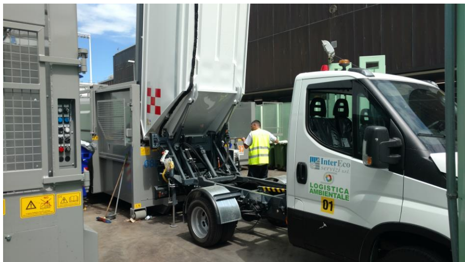
Raccolta rifiuti in aeroporto e conferimento presso isola ecologica