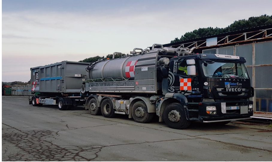
Trasporto cisterna e compattatore