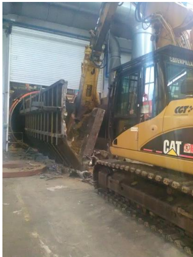
Fasi preliminari demolizione autoclave