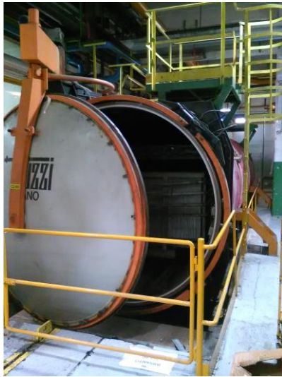
Autoclave prima dell'intervento