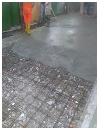
Ripristino pavimentazione con c.a.