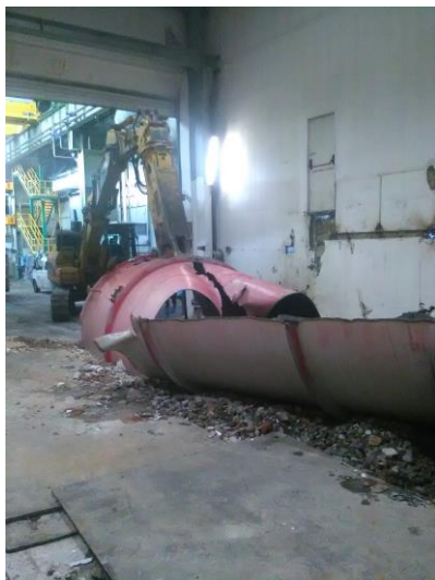
Fasi finali demolizione autoclave