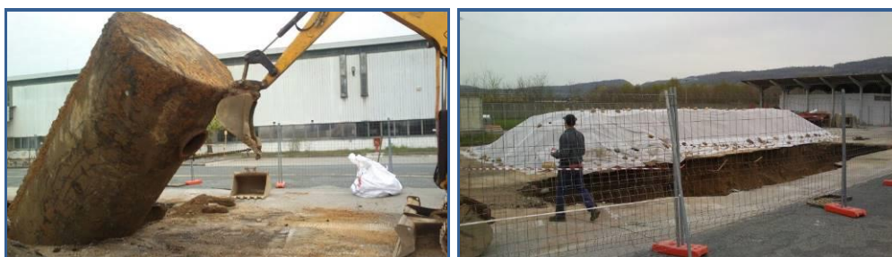
Estrazione serbatoio interrato ed analisi terreno, fondo scavo e pareti