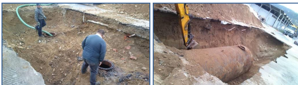
Bonifica interna serbatoio e scavo per estrazione