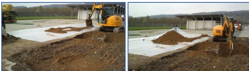
Scavo asfalto e terreno