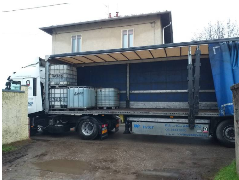
Fase finale di carico rifiuti speciali