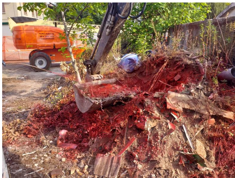
Bonifica macerie contenenti amianto