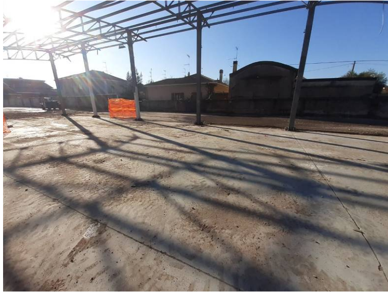
Aree post bonifica e demolizione