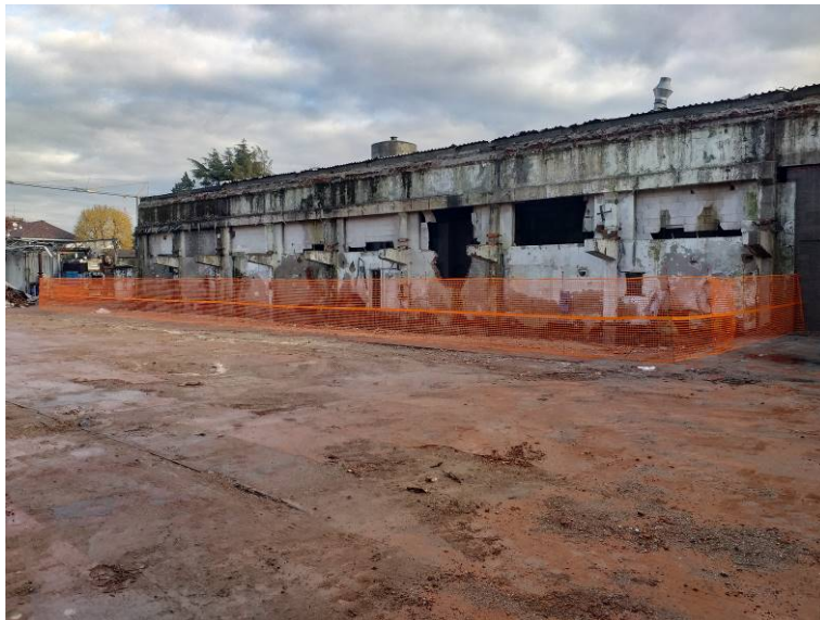
Aree post bonifica e demolizione