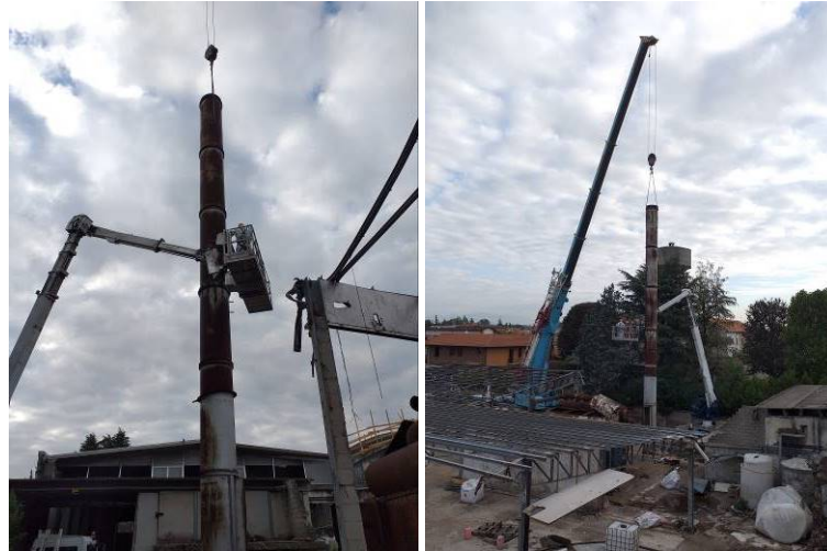
Demolizione impianti in quota