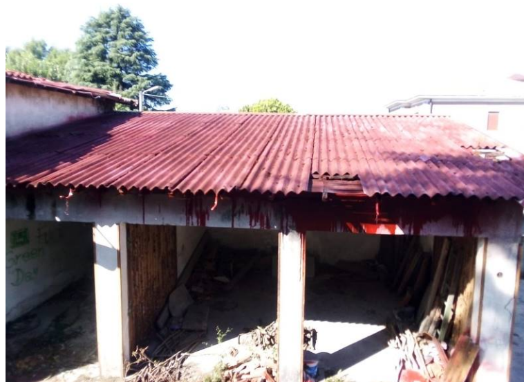
Bonifica coperture in amianto