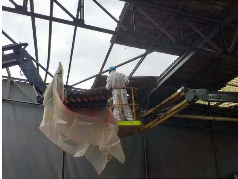
Bonifica coperture in amianto