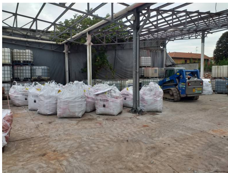
Rimozione rifiuti speciali solidi e liquidi