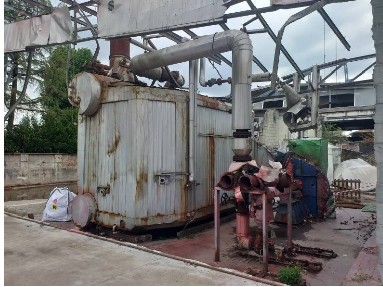
Demolizione impianti interrati e fuori terra