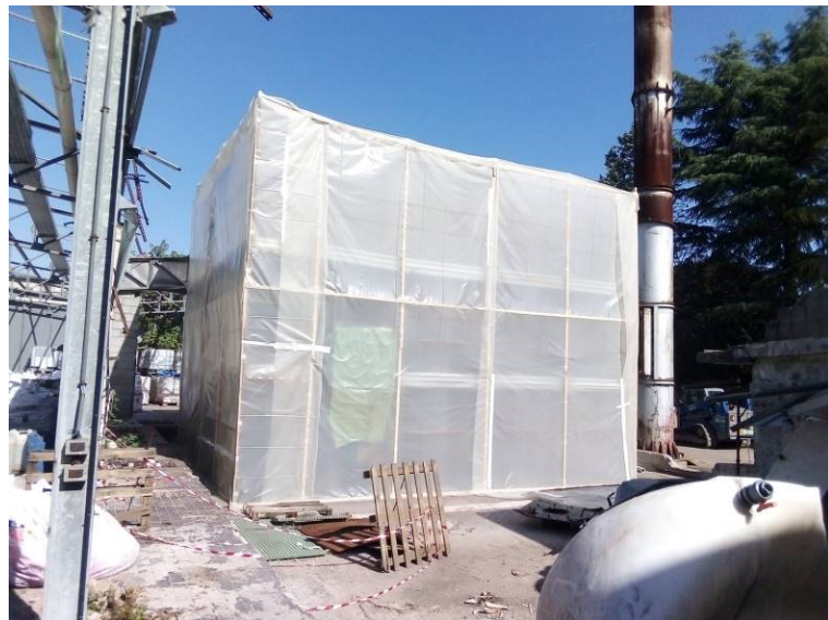
Bonifica impianti con amianto /FAV in confinamento statico