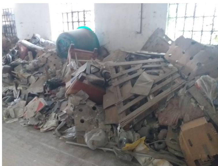
Macerie e rifiuti oggetto di intervento